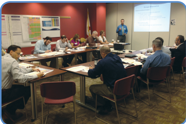
Komite Konsiltatif Pwojè a (Project Advisory Committee) pou etid University Drive la, te rankontre le 7 me nan Biwo Broward County Transit.